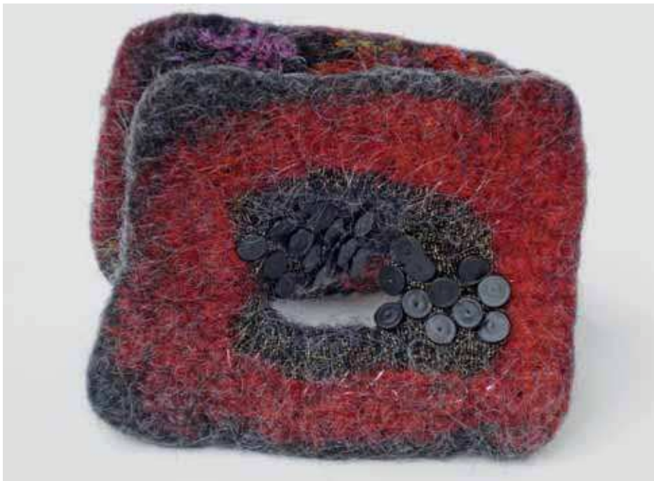
Met zwarte dopjes als voorlopers van de vilten bultjes

De compacte penningen voelden stuk voor stuk lekker aan. Maar ze verschaften wat minder ruimte voor tekst. Naast de twee kleurrijke voorbeelden die samen te zien zijn op de foto, ontstond een derde penning in een meer gedekte kleur. Net als de frivole penning met de wapperende haren is ook deze niet het prototype voor de mediationpenning geworden. De uiteindelijke keus viel op de penning met de rode en bruine kleuren en een plastisch goed uitgekende verschijningsvorm. Bovendien was die voldoende plat, maar hij kon ook rechtop staan. Deze penning voelde zeer plezierig aan, mede door het volume van de vilten bultjes net onder de opening, die de overwonnen hobbels aan weerszijden symboliseren. Er is genoeg plaats over op de bruine buitenste randen voor het opborduren van tekst. Het is heerlijk voelen met je vingers door de gaten en het naar weerszijden keren van de viltstof gaat, ondanks de dikte van het vilt bij dit model, heel soepel.