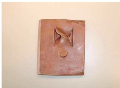
De Holst penning